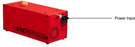
FT-20S Power Base (Optional)