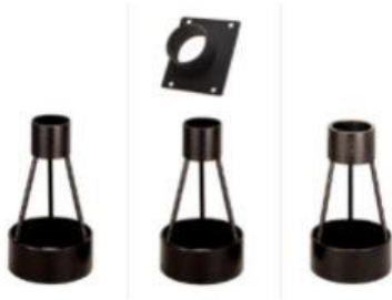
FTA-1 FTA-2A FTA-3